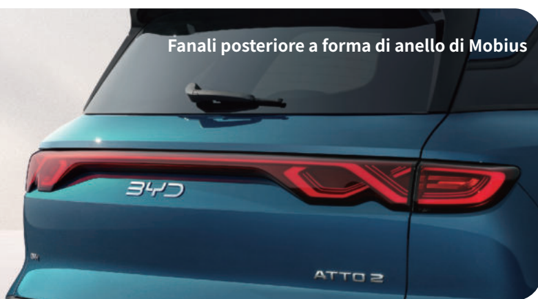
Fanali posteriore a forma di anello di Mobius